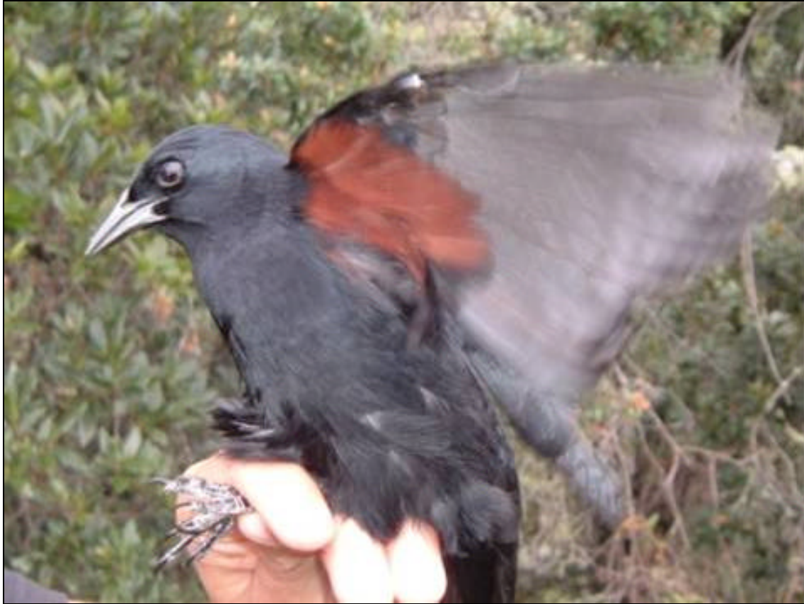
Figura 1. Individuo de Cocha de Montaña, capturado en redes 19 de julio de 2005.

A pesar de que el hábitat potencial de Macroagelaius subalaris está estimado en 2600 Km 2 (Amaya & Renjifo 2002), las poblaciones conocidas actualmente en Colombia ocupan en conjunto un área muy pequeña; la población de Sylvania (Cundinamarca) no ha sido observada desde 1969. Los datos disponibles actualmente no permiten hacer un cálculo preciso de la densidad de M. subalaris en Soatá, pero la población total de estas aves en la región se podría estimar en al menos 40 individuos, dado el grupo más