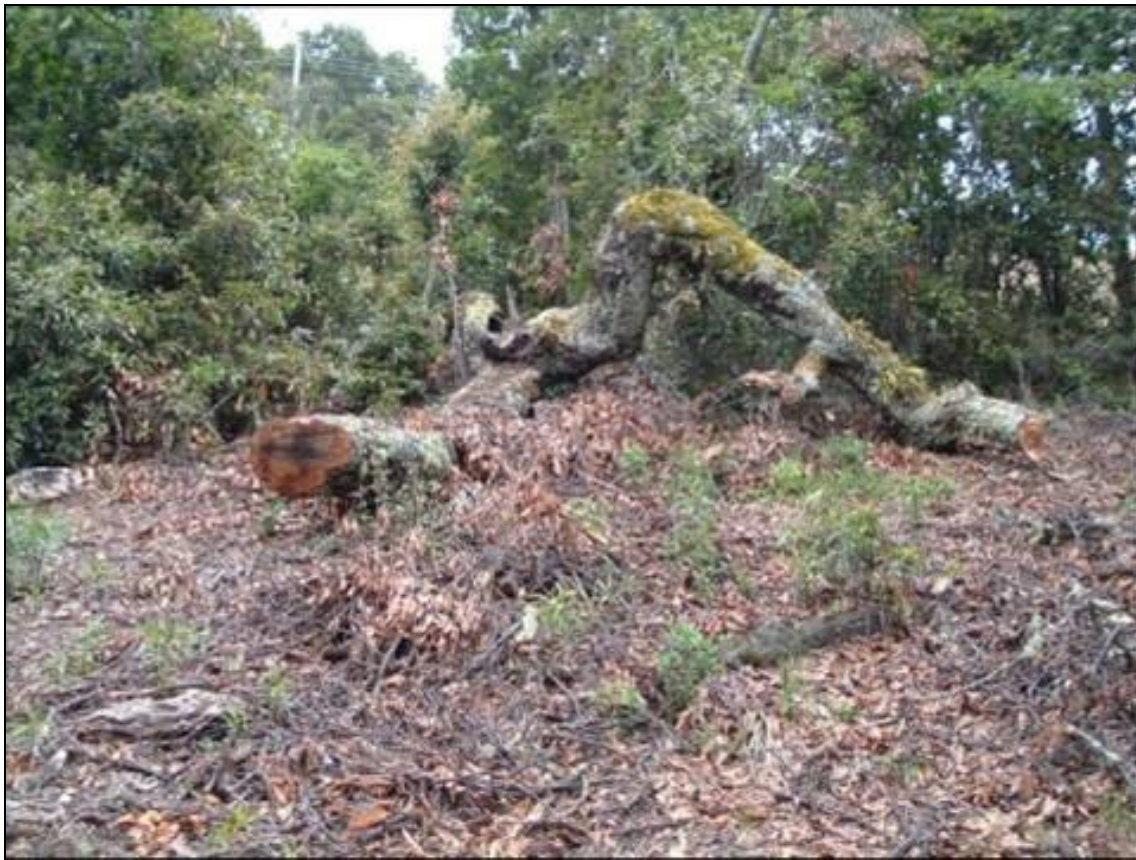
Figura 2. Tala de los bosques de Roble en el Alto de Onzaga (Soatá).

propenden por la conservación de la avifauna local y prohíben la caza y la deforestación; por otro lado existe la posibilidad de que existan más poblaciones de esta especie en otras regiones aledañas con presencia de roble, como los municipios de Tipacoque y Susacón. Asimismo, estamos adelantando trabajos de educación ambiental para sensibilizar a los pobladores locales sobre la conservación de los bosques de roble.