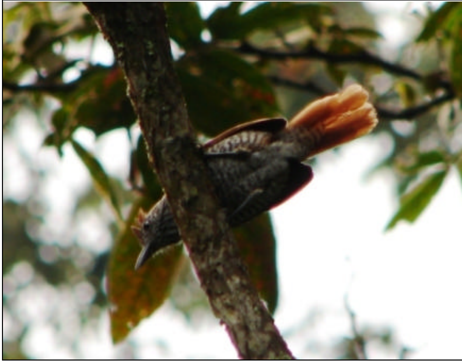
Thamnophilus multistriatus Batará Carcajada – Bar-crested Antshrike (macho – male)