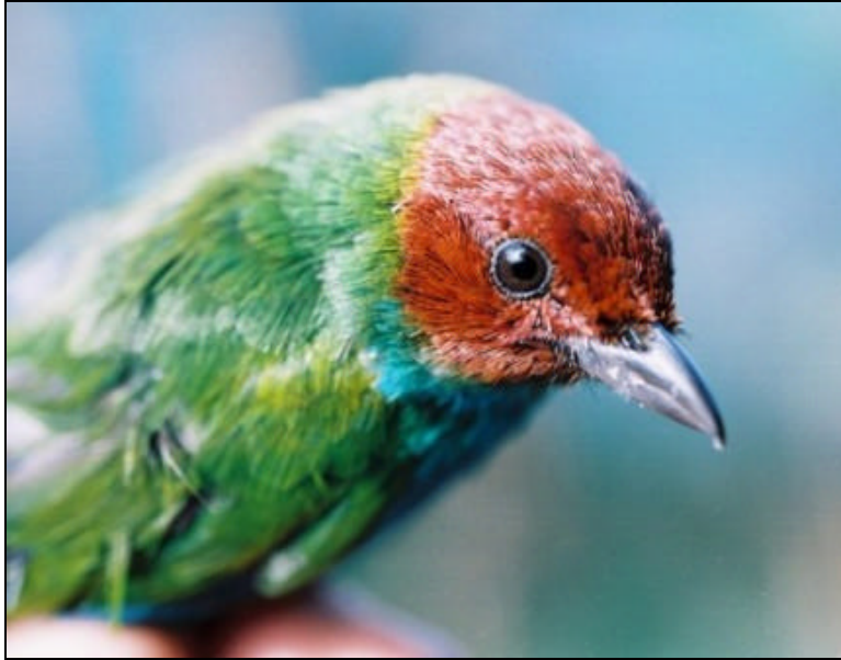
Tangara gyrola Tangará Cabecirrufa – Bay-headed Tanager