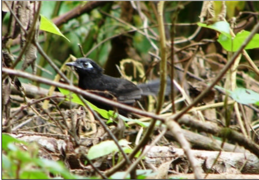
Myrmecyza immaculata Hormiguero Inmaculado – Immaculate Antbird (macho – male)