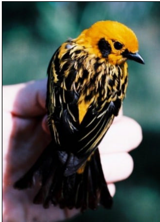
Tangara arthus Tangará Dorada – Goleen Tanager