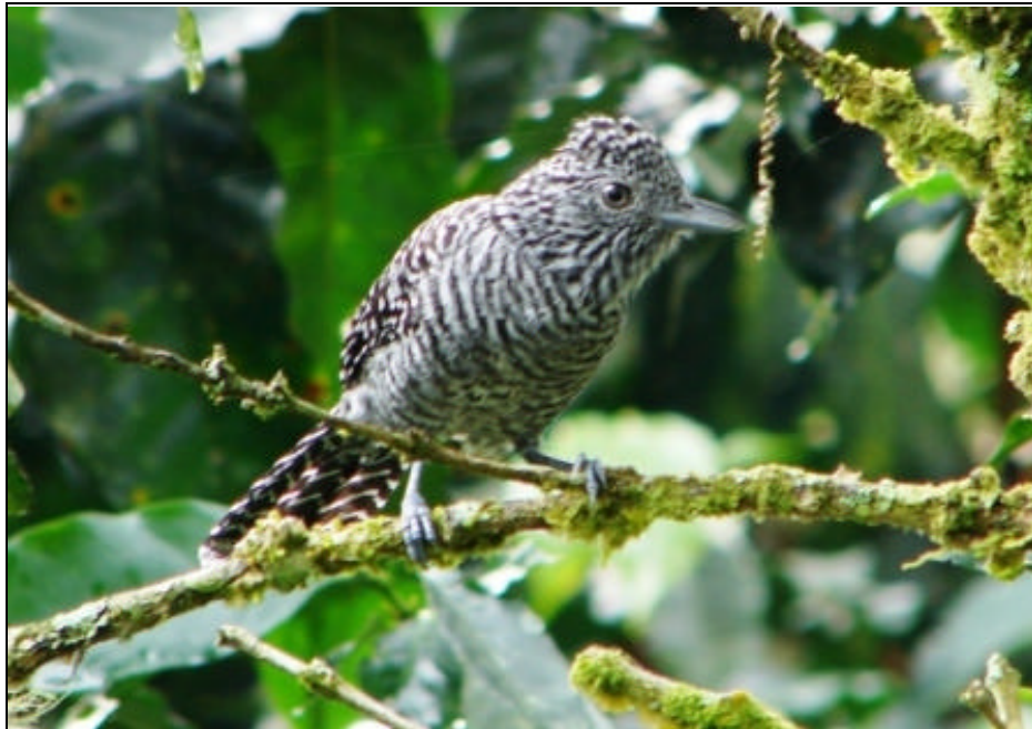
Thamnophilus multistriatus Batará Carcajada – Bar-crested Antshrike (hembra – female)