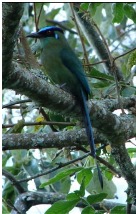
Momotus momota Barranquero Coronado – Blue-crowned Motmot