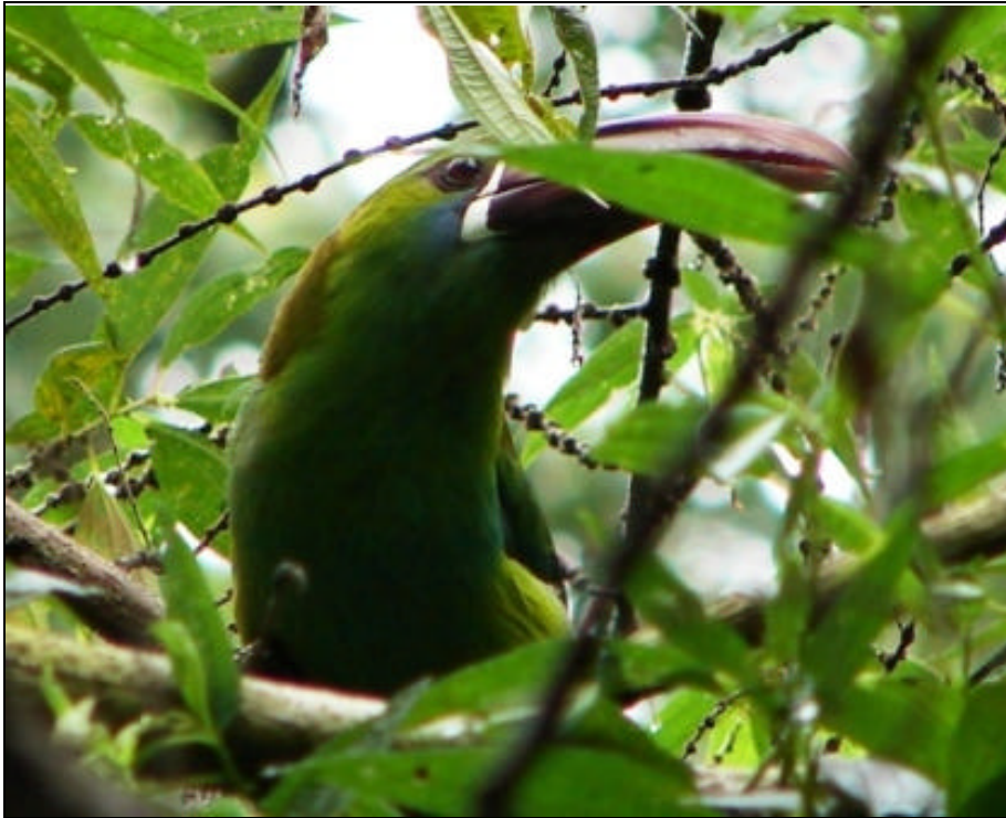
Aulacorhynchus haematopygus Tucancito Culirrojo – Crimson-rumped Toucanet