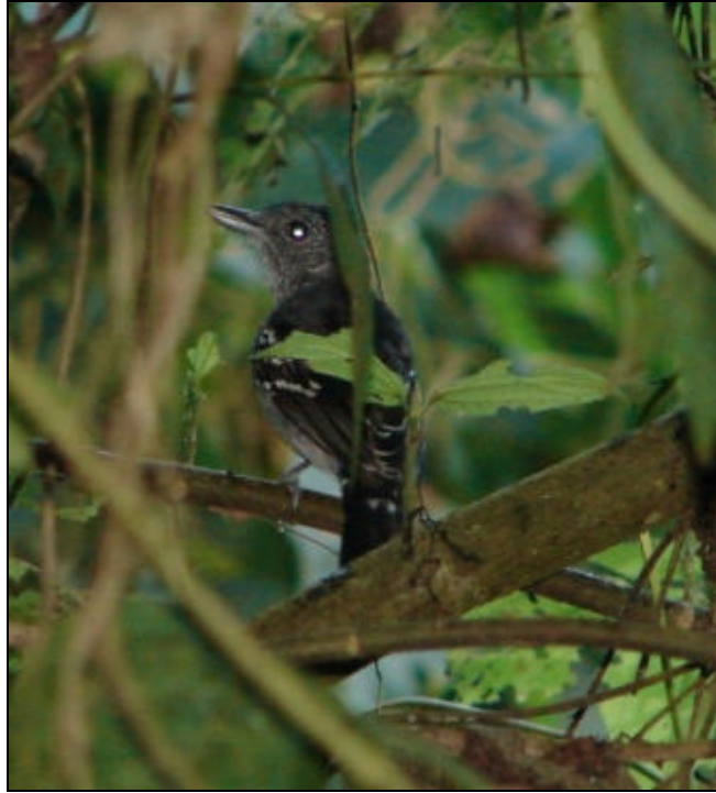
Thamnophilus atrinucha Batará Occidental – Western Slaty Antshrike (macho - male)