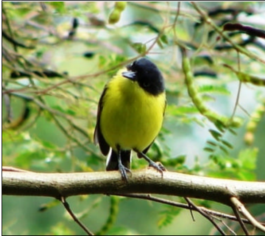
Todiostrostrum cinereum Espatulita Común – Common Tody-Flycatcher