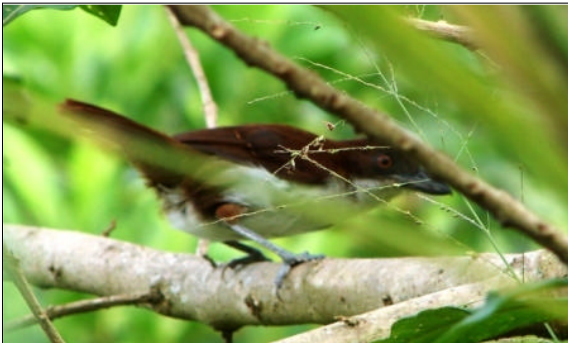
Taraba major Batará Grande – Great Antshrike (hembra – female)