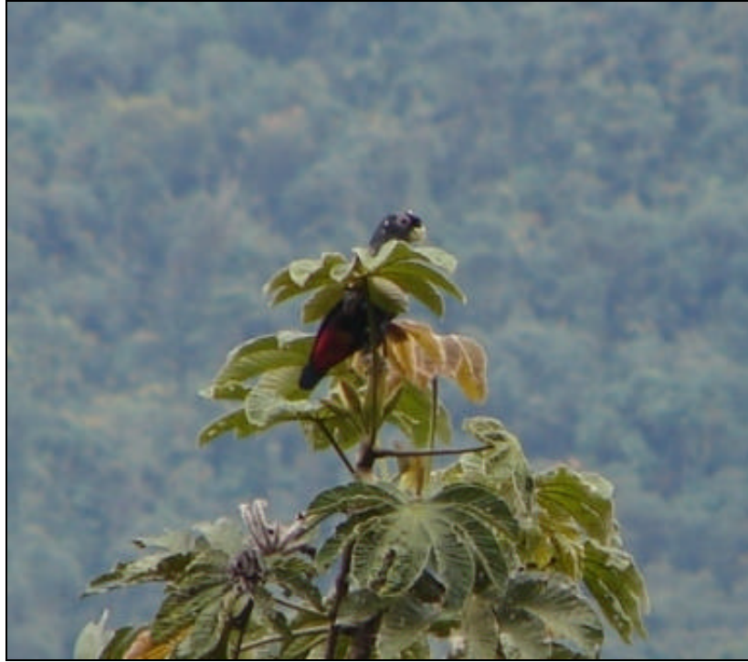
Pionus chalcopterus Cotorra Oscura – Bronze-winged Parrot