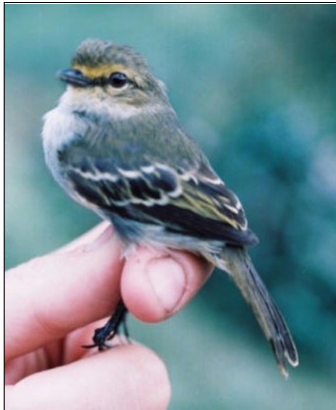
Zimmerius chrysops Tiranuelo Cejamarillo – Goleen-faced Tyrannulet