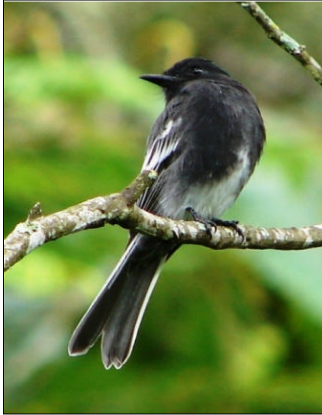
Sayornis nigricans Atrapamoscas Cuidapuentes – Black Phoebe