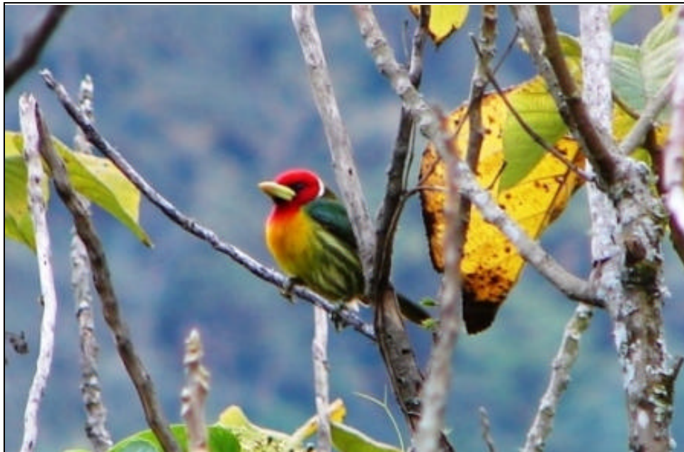
Eubucco bourcierii Torito Cabecirrojo – Red-headed Barbet (macho – male)