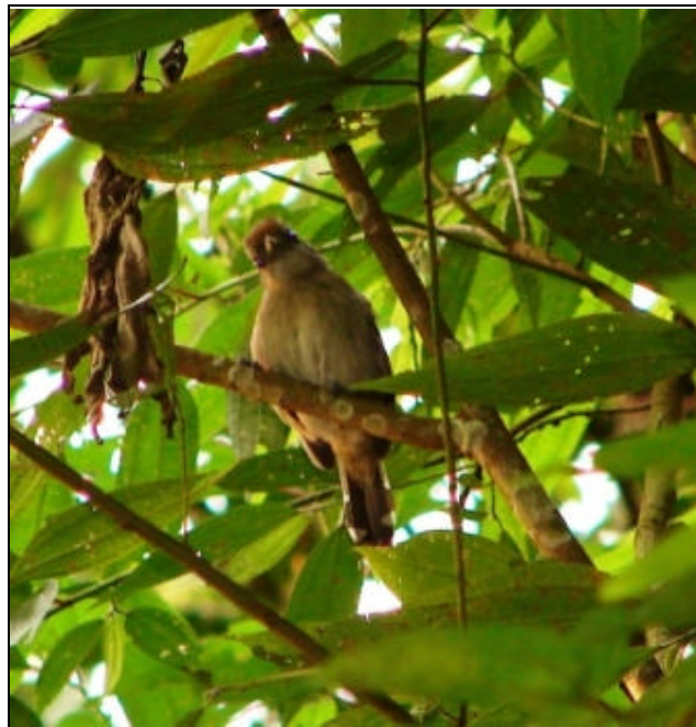
Thamnophilus atrinucha Batará Occidental – Western Slaty Antshrike (hembra - female)