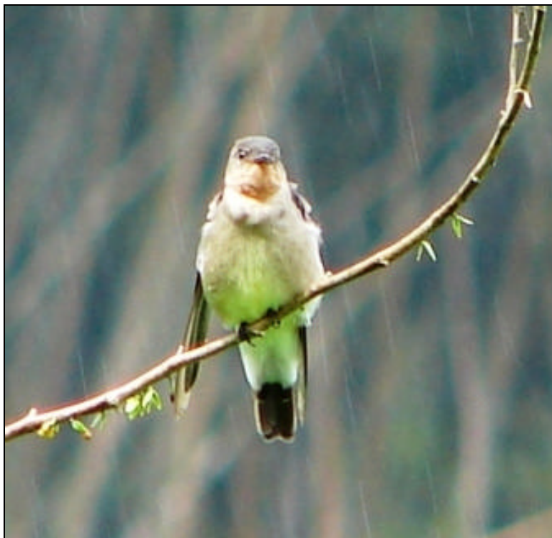
Stelgidopteryx ruficollis Golondrina Barranquera – Southern Rough-winged Swallow