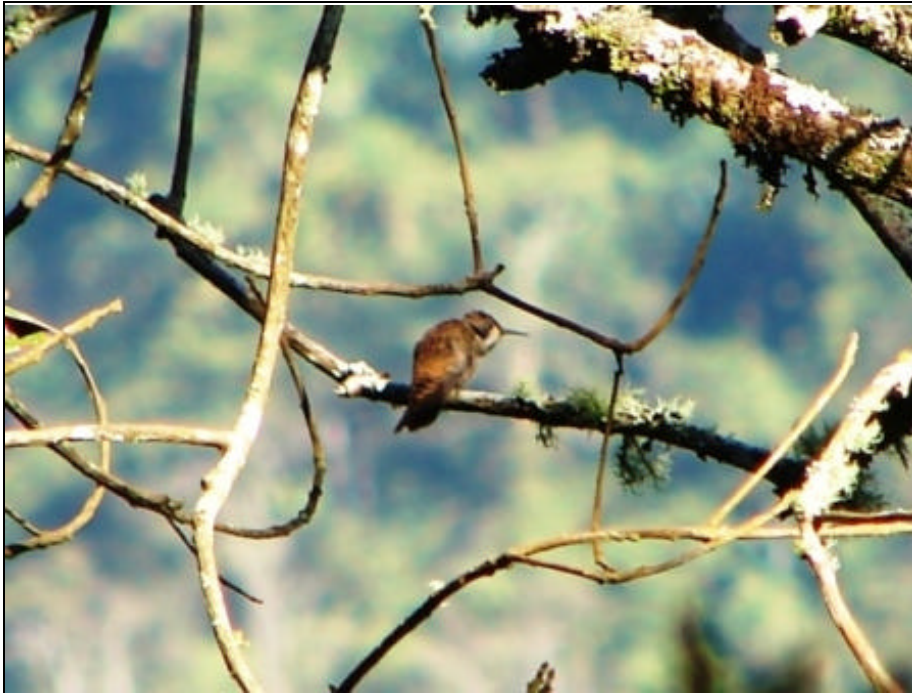
Colibri delphinae Colibrí Pardo – Brown Violetear