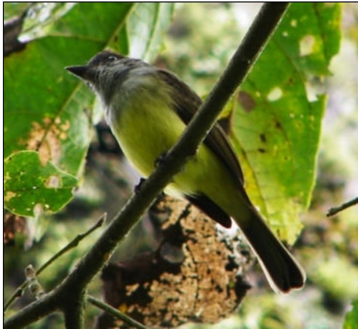
Myiarchus tuberculifer Atrapamoscas Cabecinegro – Dusky-capped Flycatcher