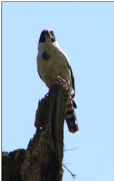
Herpetotheres cachinnans Halcón Reidor – Laughing Falcon