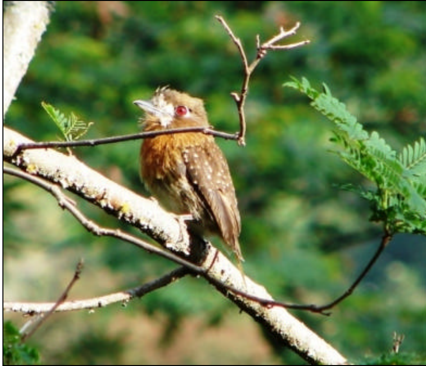
Malacoptila mystacalis Bogitudo Canoso – Moustached Puffbird