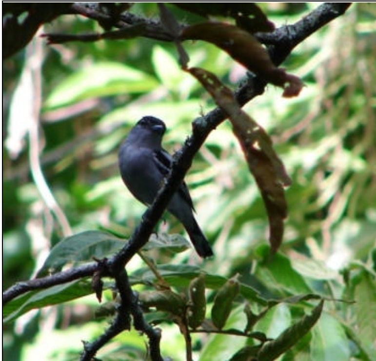
Pachyramphus polychopterus Cabezón Aliblanco – White-winged Becard