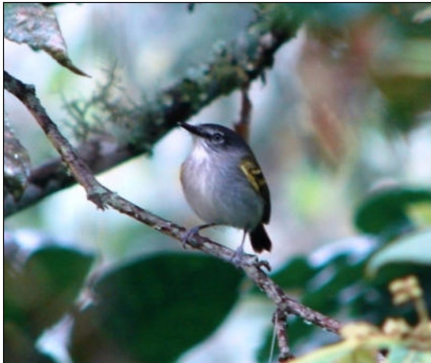
Todiostrostrum sylvia Espatulita Rastrojera – Slate-headed Tody-Flycatcher