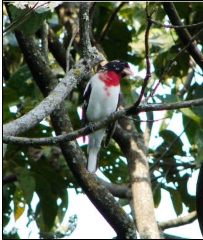
Pheucticus ludovicianus Picogordo Degollado – Rose-breasted Grosbeak

He tenido la oportunidad de trabajar en varias localidades de la Cordillera Occidental de los Andes Colombianos. El café y el cardamomo, así como los cultivos de pancojer, son componentes que dominan el paisaje en esta cordillera entre los 500 y 2000 m.s.n.m. En estos hábitats la mayoría de las especies son identificadas por los habitantes locales debido a su contacto día a día con ellas mientras trabajan la tierra. He querido compartirles algunas de las fotos que he hecho mientras he trabajado en estas localidades; todas las fotos que aquí presento son de aves frecuentemente encontradas en cultivos de café y cardamomo de sombrío en los municipios de Andes y Jericó del departamento de Antioquia, Colombia. Las fotografías fueron hechas con una cámara Sony DSC H1.