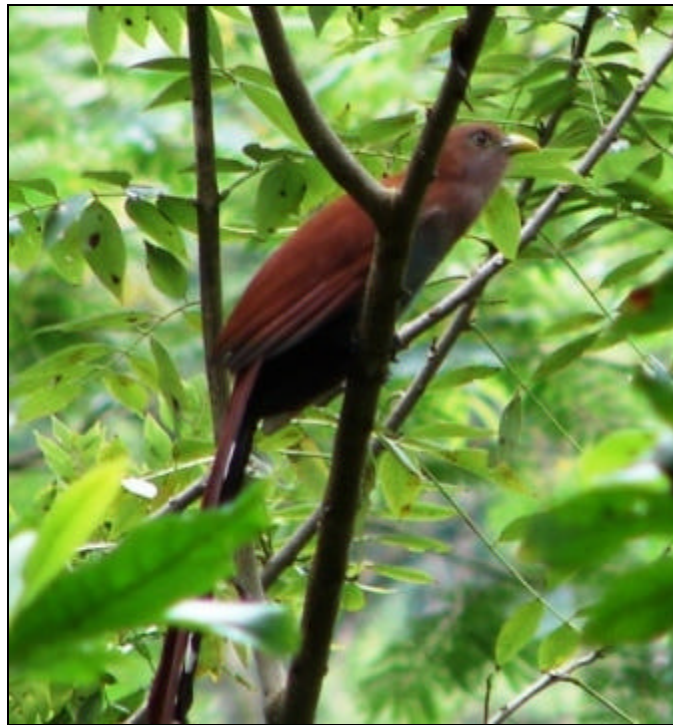
Piaya cayana Cuco-ardilla Común – Squirrel Cuckoo