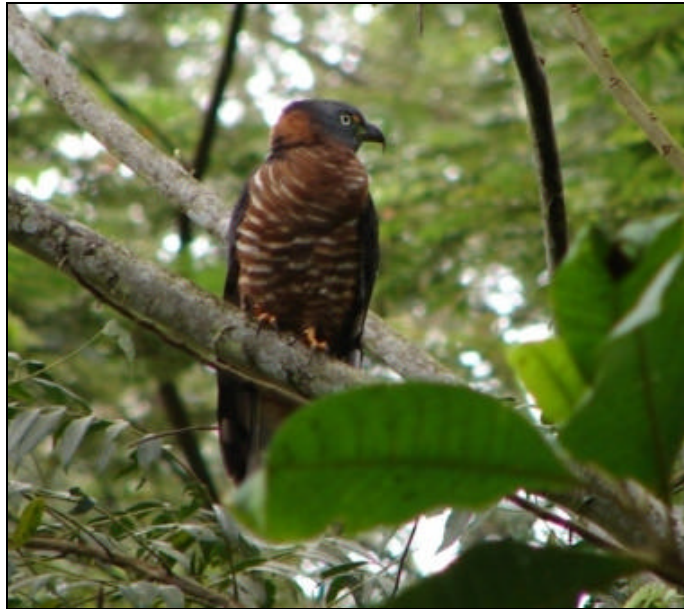
Chondrohierax uncinatus Caracolero Piquiganchudo – Hook-billed Kite