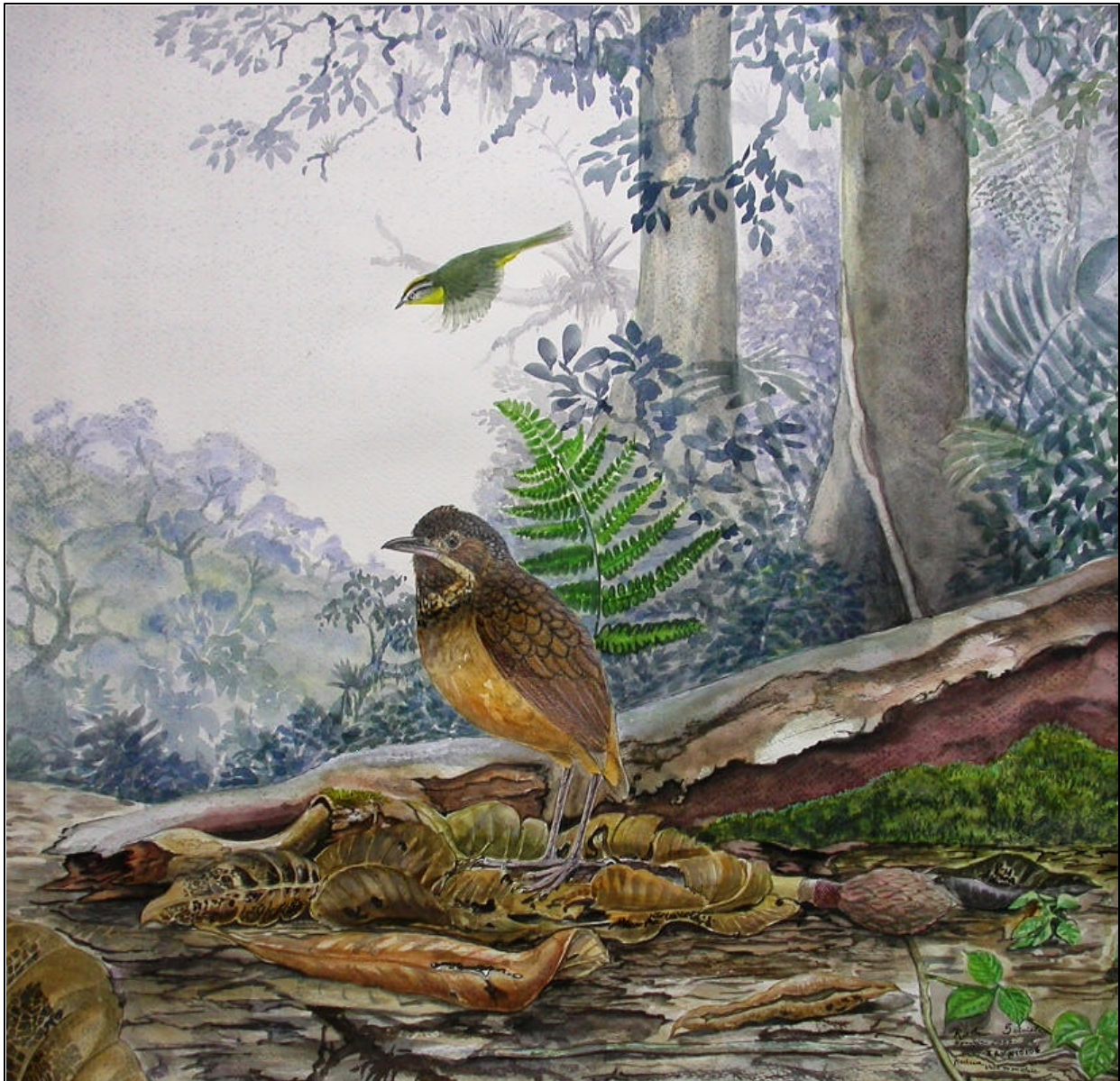
Grallaria guatimalensis Tororoi Dorsiescamado – Scaled Antpitta

Andes Colombianos, (21,8 x 20,4"), Watercolor on watercolor paper and varnish. Basileuterus culicivorus at the background.