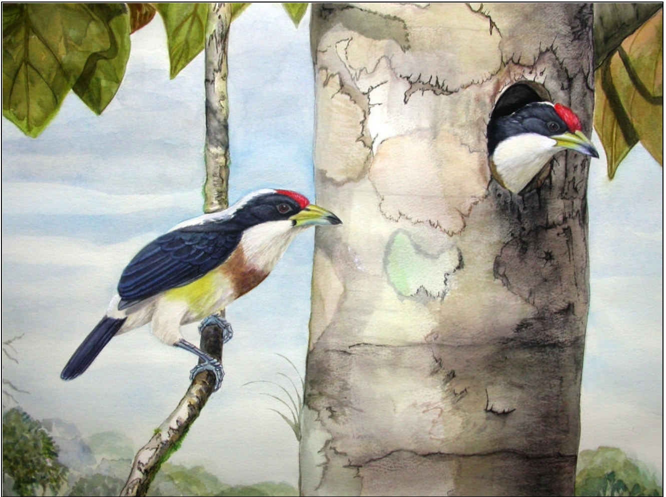
Capito hypoleucus extinctus Torito Dorsiblanco – White-mantled Barbet (Female left, male right)

Serranía de Las Quinchas, Colombia (29,9 x 22,4"), Watercolor on watercolor paper and varnish (detail).