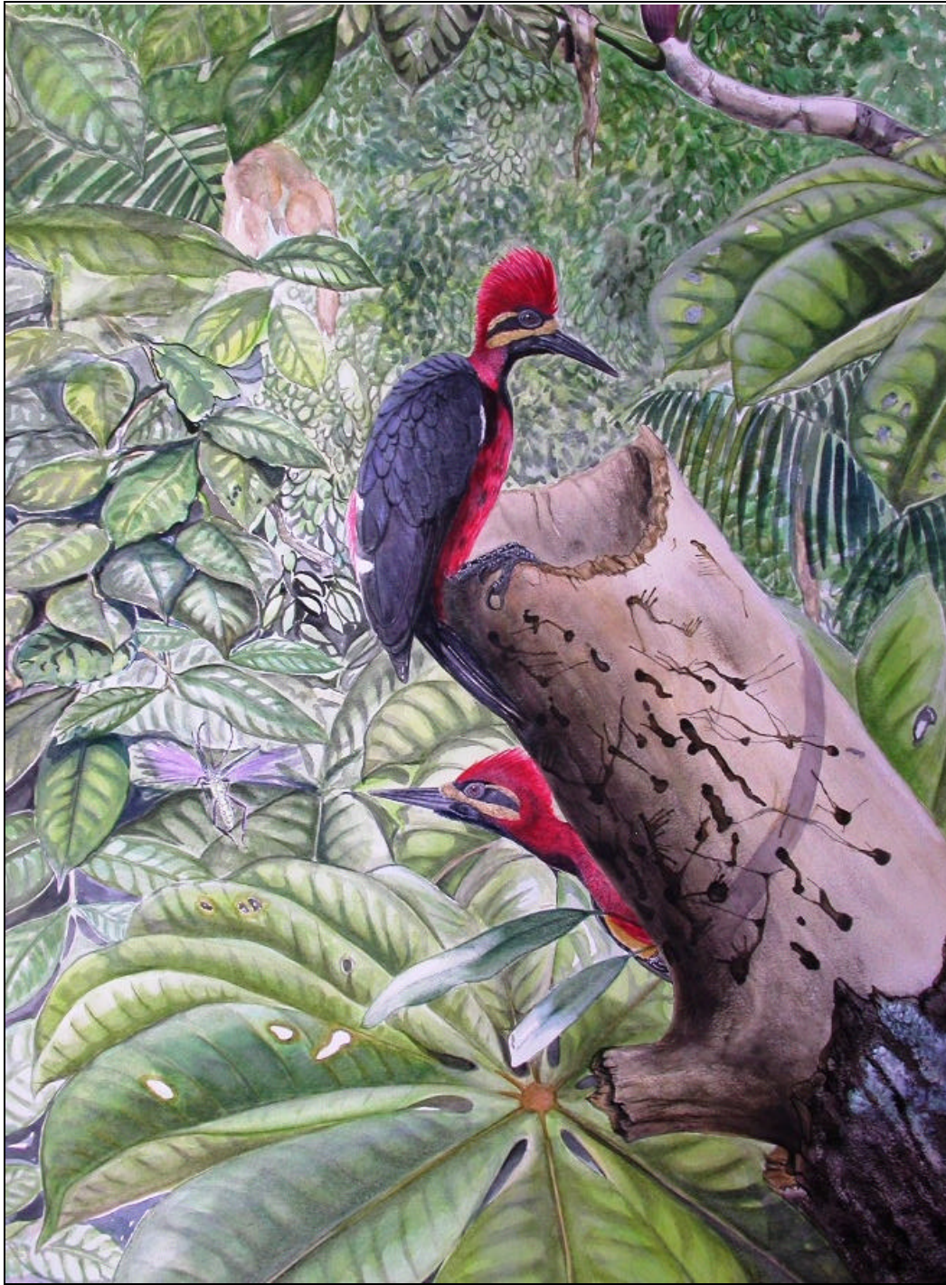
Campephilus haematogaster splendens Carpintero Selvático – Crimson-bellied Woodpecker (Male below, female above)

East Andes, Colombia, (30 x 22") Watercolor on watercolor paper and varnish.