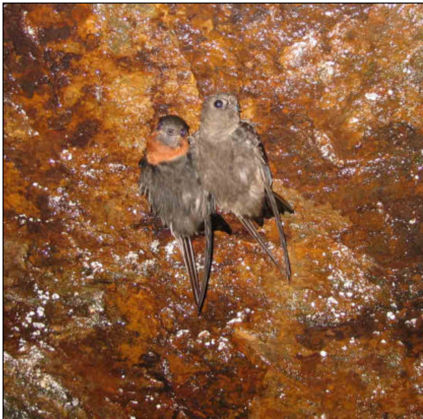
Streptoprocne rutila Vencejo de Collar Castaño – Chestnut-collared Swift

Una pareja de Streptoprocne rutila perchados en horas de la noche en una cueva del Municipio de Anorí.