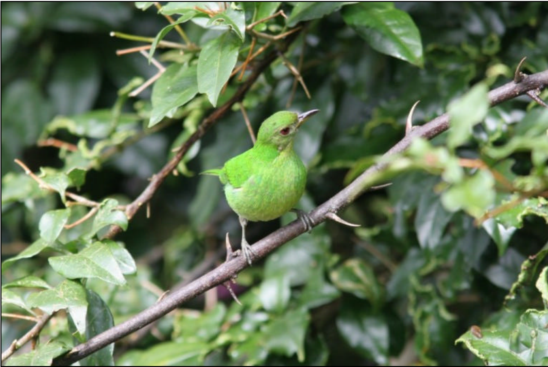
Chlorophanes spiza hembra Mihero Verde - Green Honeycreeper

Tiempo de exposición 1/250 s. Velocidad ISO 400 Distancia focal 420 mm. Flash si. Tomada en una finca localizada entre Pereira y Armenia el las cercanías de un cebadero.