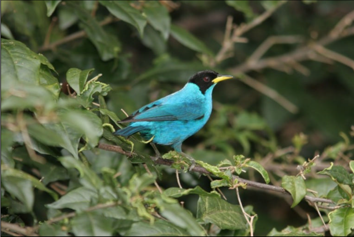
Chlorophanes spiza macho Mihero Verde - Green Honeycreeper

Tiempo de exposición 1/200 s. Velocidad ISO 200. Distancia focal 420 mm. Flash si. Tomada en una finca localizada entre Pereira y Armenia el las cercanías de un cebadero.