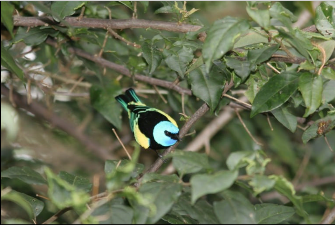
Tangara cyanicollis Tangara Real - Blue-necked Tanager

Tiempo de exposición 1/250 s. Velocidad ISO 400. Distancia focal 420 mm. Flash si. Tomada en una finca localizada entre Pereira y Armenia el las cercanías de un cebadero.