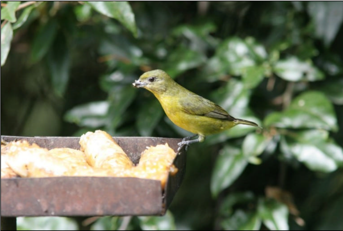
Euphonia lanirostris hembra Euphonia Gorguiamarilla - Thick-billed Euphonia

Tiempo de exposición 1/250 s. Velocidad ISO 400. Distancia focal 400 mm. Flash si. Tomada en una finca localizada entre Pereira y Armenia el las cercanías de un cebadero.