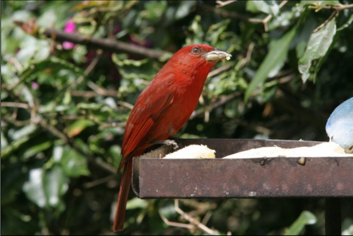
Piranga flava Piranga Abejera - Hepatic Tanager

Tiempo de exposición 1/250 s. Velocidad ISO 400. Distancia focal 400 mm. Flash si. Tomada en una finca localizada entre Pereira y Armenia el las cercanías de un cebadero.