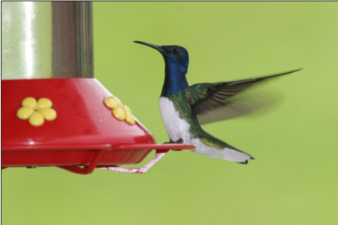
Florisuga mellivora Colibrí Nuquiblanco - White-necked Jacobin