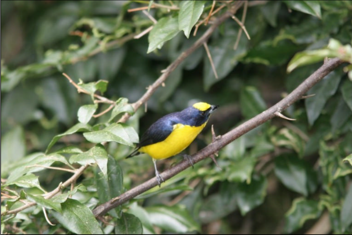
Euphonia lanirostris macho Euphonia Gorguiamarilla - Thick-billed Euphonia

Tiempo de exposición 1/200 s. Velocidad ISO 200. Distancia focal 420 mm. Flash si. Tomada en una finca localizada entre Pereira y Armenia el las cercanías de un cebadero.