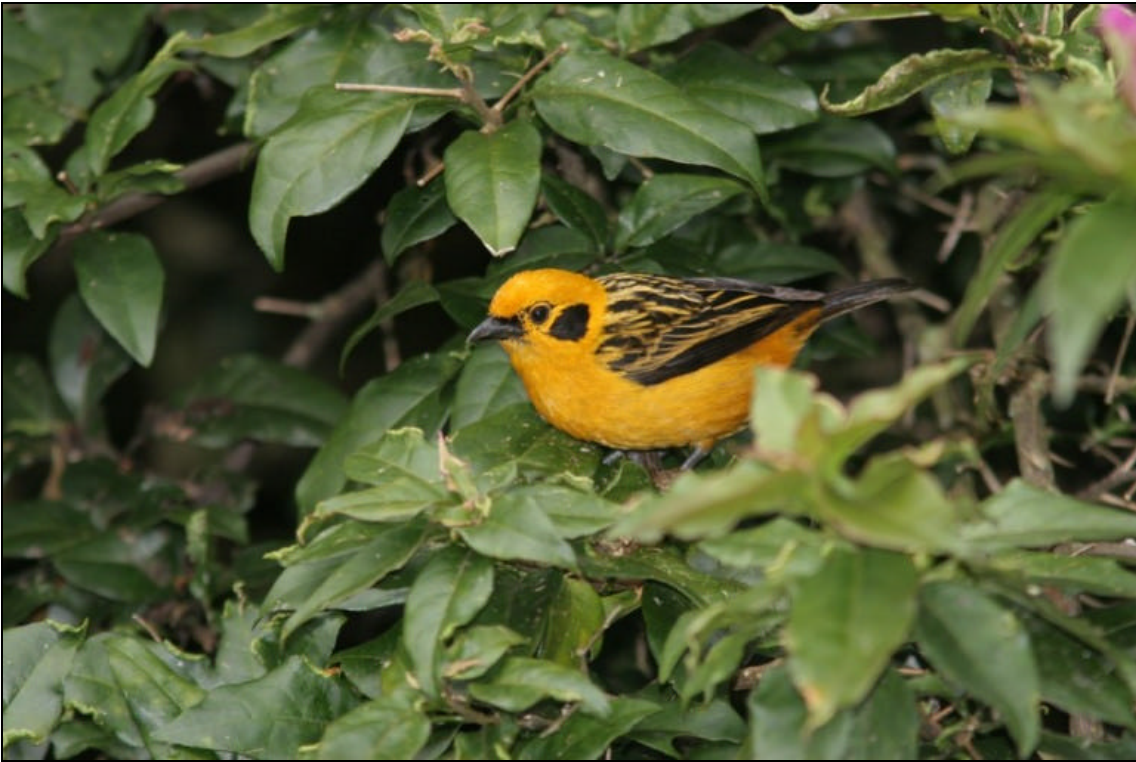
Tangara arthus Tangara Dorada - Golden Tanager

Tiempo de exposición 1/200 s. Velocidad ISO 200 Distancia focal 420 mm. Flash si. Tomada en una finca localizada entre Pereira y Armenia el las cercanías de un cebadero.