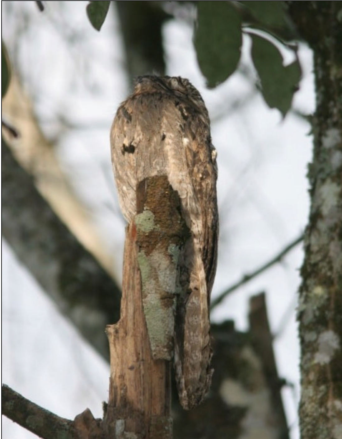
Nyctibius griseus Bienparado Común - Common Potoo