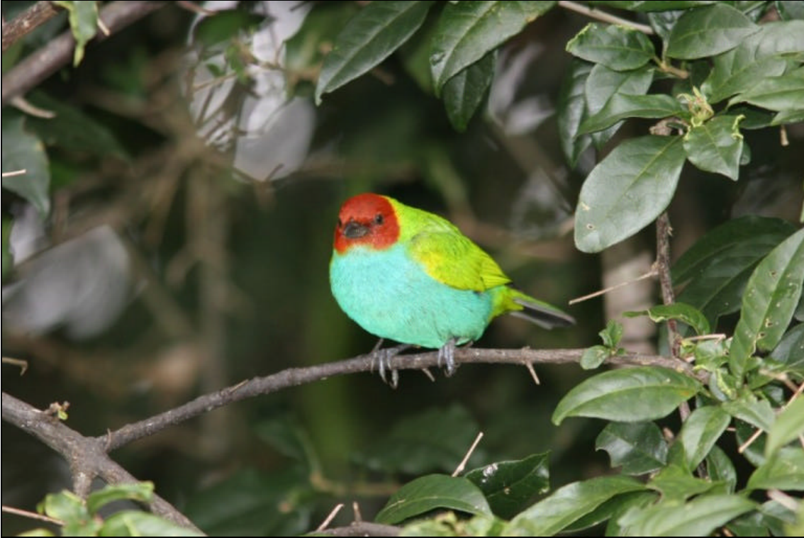
Tangara gyrola Tangara Cabecirrufa - Bay-headed Tanager

Tiempo de exposición 1/250 s. Velocidad ISO 400. Distancia focal 400 mm. Flash si. Tomada en una finca localizada entre Pereira y Armenia el las cercanías de un cebadero.