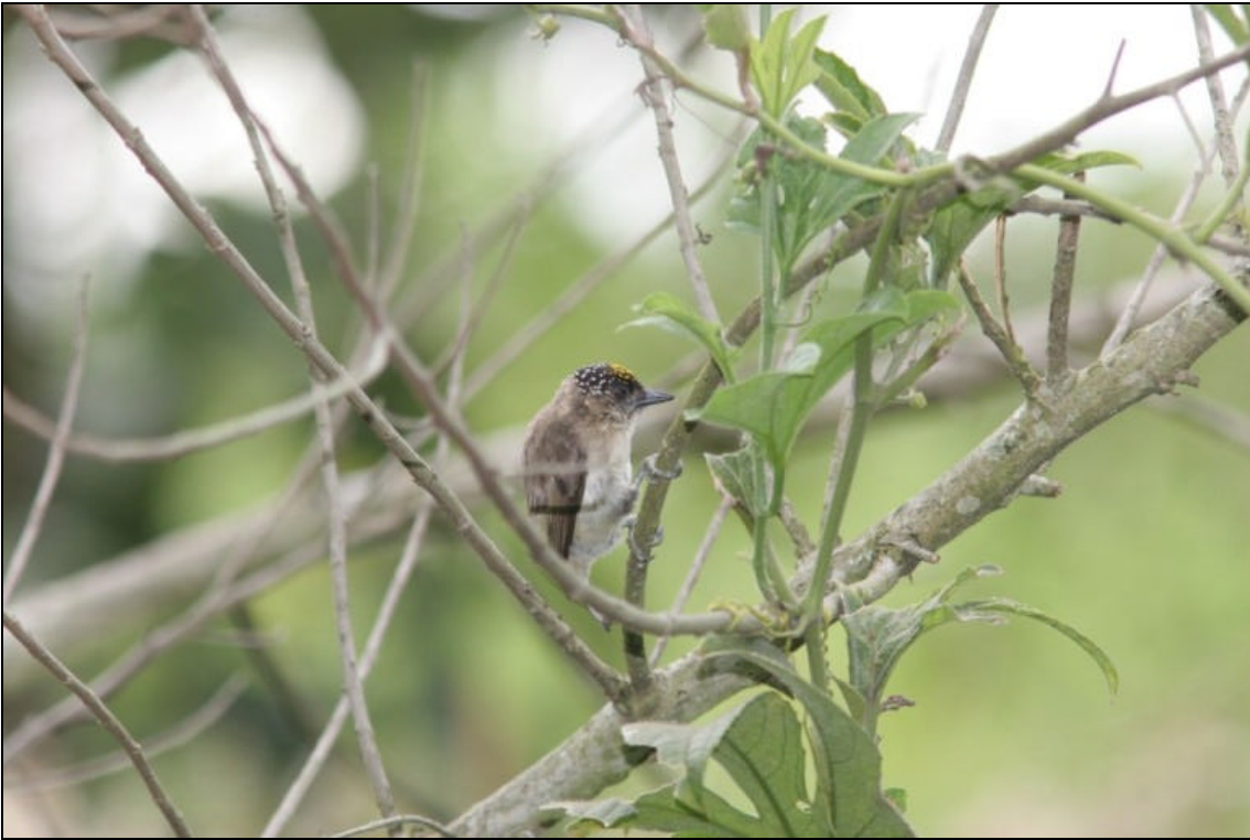
Picumnus granadensis Carpinterito Punteado - Grayish Piculet

Tiempo de exposición 1/250 s. Velocidad ISO 400. Distancia focal 400 mm. Flash si. Tomada en una finca localizada entre Pereira y Armenia en las cercanías de un cebadero.